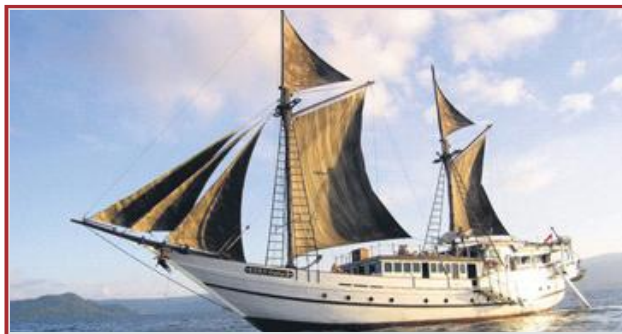
El 'Ondina'. La expedición viajó a bordo del 'Ondina', una bella goleta construida a mano, siguiendo las tradiciones de los antiguos navegantes de Sulawesi, de 20 metros de eslora. La embarcación está diseñada para el buceo y perfectamente equipada, con zodiacs para llegar hasta los lugares de inmersión. El 'Ondina' recorrió más de mil kilómetros.

EN ESTA AVENTURA SUBMARINA SE EXPLORARON LAS ZONAS MÁS VÍRGENES DE INDONESIA