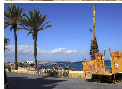
EL PUERTO NATURAL DE ES CALÓ, REFUGIO DE PESCADORES (ARRIBA) Y PASEO MARÍTIMO DE PUJOLS (ABAJO).