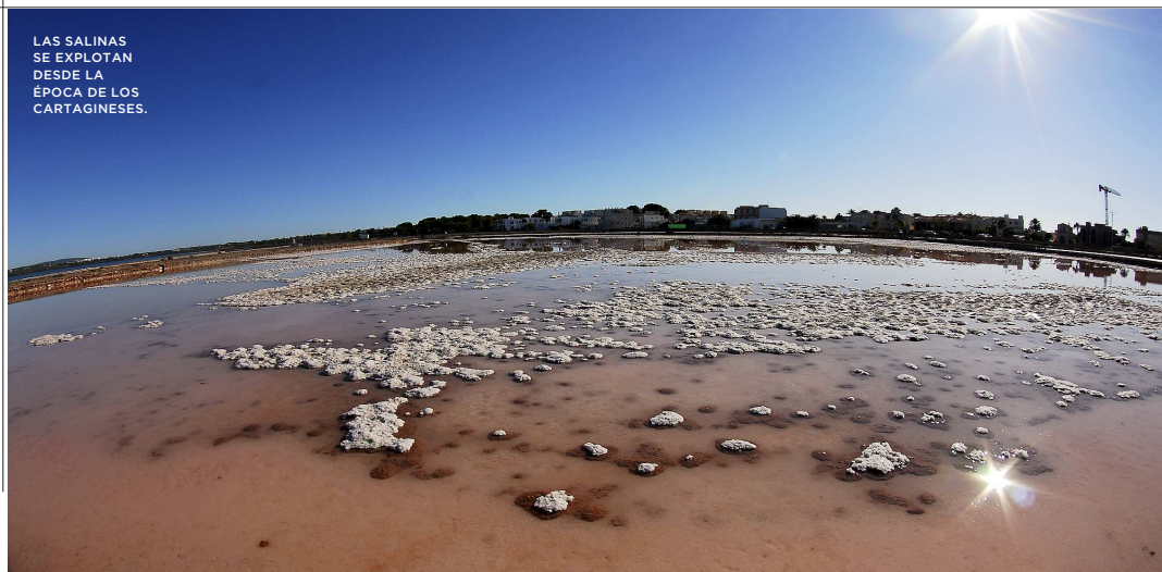
LAS SALINAS SE EXPLOTAN DESDE LA ÉPOCA DE LOS CARTAGINESES.

Entre las más escondidas están Cala Savina, al abrigo de uno de los espigones que cierran el puerto de La Savina, y Ses Bassetes, un conjunto de recortadas calitas que se han ido formando a los pies del cabo del mismo nombre. Y, entre las más conocidas, destaca Cala Saona, con fama de tener bellos atardeceres. Su tranquilidad y belleza característica la convierten en una visita obligada desde donde disfrutar de las maravillosas panorámicas que ofrece la vecina isla de Ibiza, de la costa de Punta Pedrera o de los bellos acantilados de Punta Rasa, a los que se puede acceder fácilmente a pie, ya que están a escasos 10 minutos de la playa. Y también Platja de Migjorn –el paraje más virgen y sereno del litoral–, Es Caló –pequeño puerto natural y refugio de pescadores, ideal para saborear el mar en un entorno marinero– y Caló des Mort –un maravilloso rincón rodeado por acantilados bajos y algunas casetas de pescadores– son otras tres de las calas más célebres.