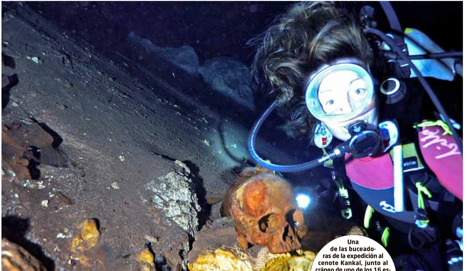
Una de las buceadoras de la expedición al cenote Kankal, junto al cráneo de uno de los 16 esqueletos completos descubiertos que podrían corresponder a indígenas mayas sacrificados en honor a Chab, dios de la lluvia.

Cientos de años antes de la llegada de Cortés, los habitantes de la península de Yucatán arrojaban a niños a profundos cenotes para que su dios trajera la lluvia. Un periodista de 'Eureka' se sumerge y halla los restos