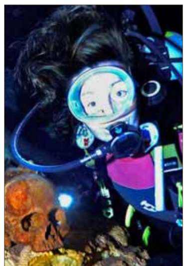
El yacimiento submarino.

Freire gana con autoridad su tercera Milán-San Remo Páginas 32 a 40